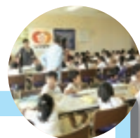
会議室での説明の様子