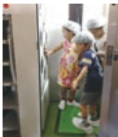
エアシャワー体験の様子

シマダヤでは、前年に引き続き、今年で2回目となる夏休み 従業員家族 製麺教室&工場見学を開催しました。参加者も増し、製麺教室では“麺に関するノウハウ”や“うどんのおいしさについて”の説明を聞き、その後、手打ちうどんを作って試食しました。工場見学では、製造機械の説明を聞き、途中エアシャワーの体験を行うなど、子どもたちは大喜び。家族で過ごす楽しい夏休みの思い出となり、普段とは違った社内コミュニケーションが図れました。