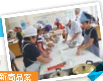
手打ちうどん作りの様子

※キャリア教育の定義：中央教育審議会「今後の学校におけるキャリア教育・職業教育の在り方について（答申）」（2011年1月31日）より抜粋 一人ひとりの社会的・職業的自立に向け必要な基盤となる能力や態度を育てることを通して、キャリア発達を促す教育