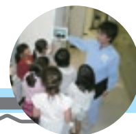
タブレットを使用している説明の様子

シマダヤでは、前年に引き続き、今年で2回目となる夏休み 従業員家族 製麺教室&工場見学を開催しました。参加者も増し、製麺教室では“麺に関するノウハウ”や“うどんのおいしさについて”の説明を聞き、その後、手打ちうどんを作って試食しました。工場見学では、製造機械の説明を聞き、途中エアシャワーの体験を行うなど、子どもたちは大喜び。家族で過ごす楽しい夏休みの思い出となり、普段とは違った社内コミュニケーションが図れました。