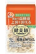
「健美麺」 食後の血糖値上昇を抑える 稲庭風細うどん3食

生活習慣病患者数の増加や平均寿命と健康寿命の差、国民医療費の増大等の社会問題に対し、シマダヤは「美味しく食べて健やかな食生活をサポートします」をコンセプトに健康志向に応える商品づくりに取り組んでいます。食塩ゼロや糖質カット、食後の血糖値上昇を抑える機能性表示食品等、家庭用・業務用あわせて23品を展開しています。(2020年9月現在)