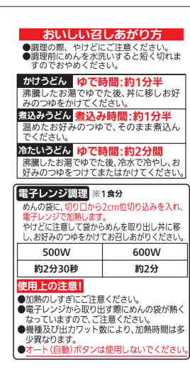
パッケージ裏面(例)

お客様相談室には販売店や、栄養成分等様々なお問い合わせが寄せられます。その中でも「調理方法」に関する問い合わせは多く寄せられており、パッケージの表示は、重要な要素であると日々痛感しています。電子レンジ調理に関するお問い合わせは、年間約100件と毎年増加傾向だったため、パッケージに記載されたことでお客様のニーズに応えられたと思います。現在、お客様の声は、毎日「日報」として、社内に配信しておりますが、今後も正確な情報をお伝えできるよう、努めてまいります。