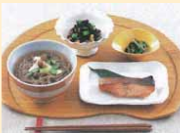
Balanced, healthy meals ヘルシーバランス定食 健康营养平衡定食套餐

适合老人和儿童的小份商品、御膳套餐或定食套餐的副菜菜品、大份商品或追加面用的面品等, 针对客户多方面的购买内容和需求高效率地提供服务。