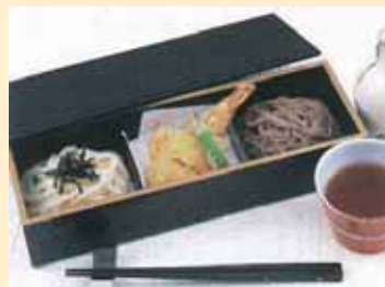
2-noodle combination tempura meal 合盛天ぷら御膳 拼盘天妇罗御膳套餐