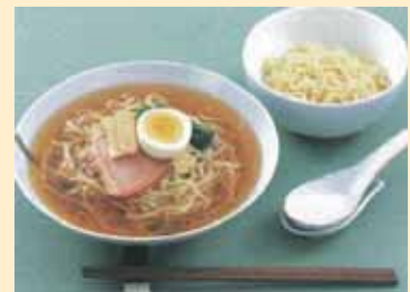
Ramen noodles (large serve) 大盛ラーメン 大份拉面